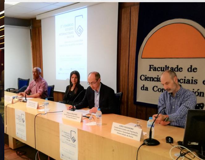
UNIVERSIDADE DE VIGO, PONTEVEDRA, GALIZA (28/03). PALESTRA SOBRE LUSOFONIA.