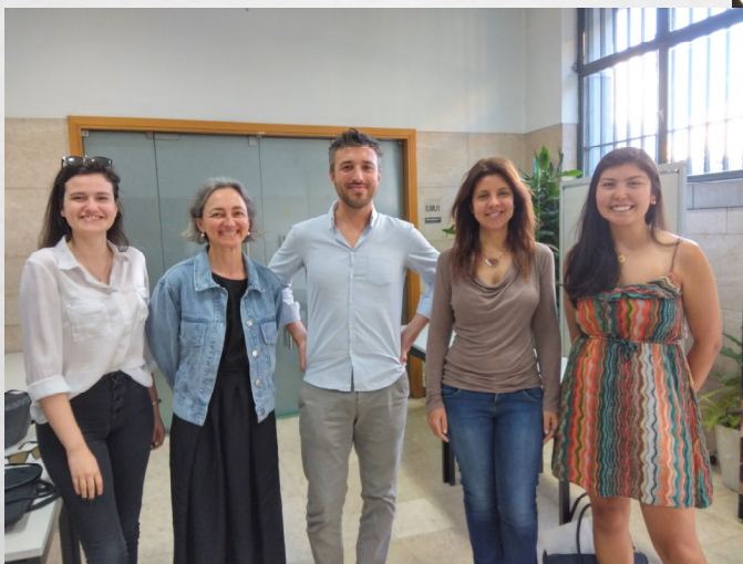
TURMA DE ESTUDOS PARLAMENTARES