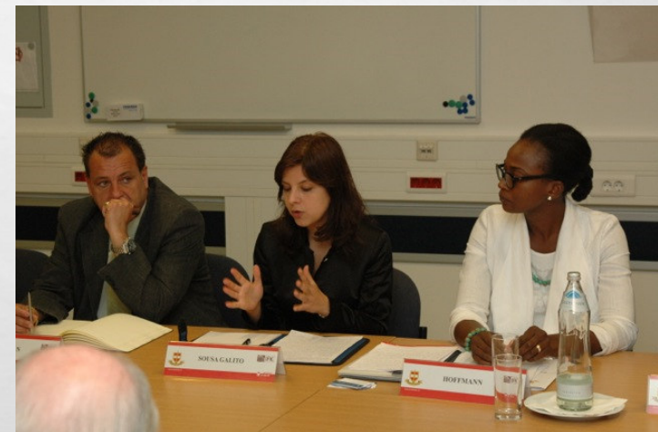
PROFESSORA NA UNIVERSIDADE LUSÓFONA (ULHT)