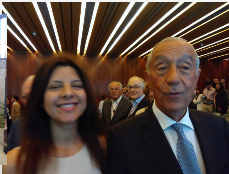
GULBENKIAN. COM O SR. PRESIDENTE DA REPÚBLICA DE PORTUGAL