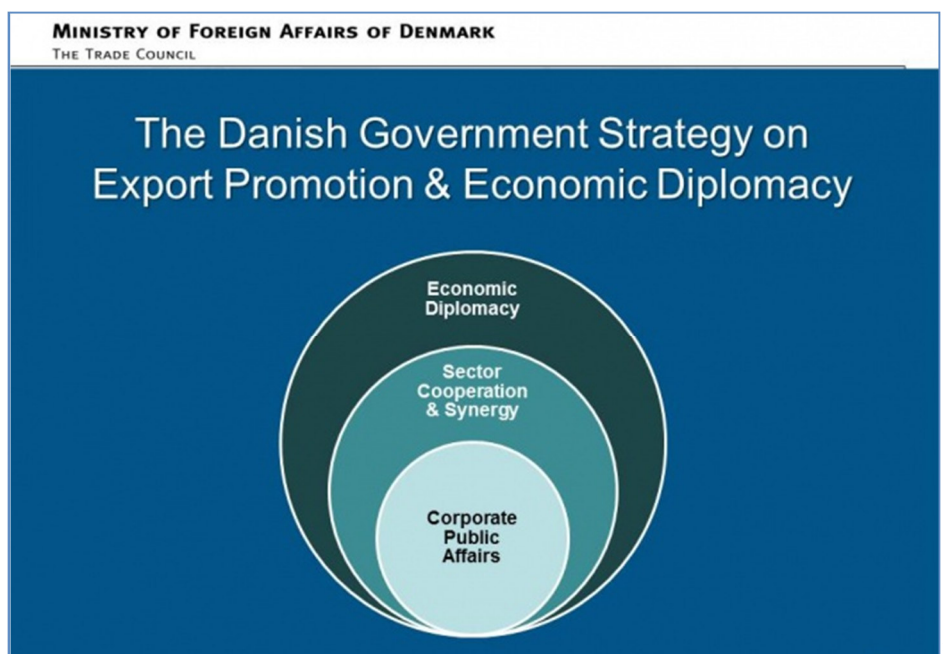
Figura 1: Diplomacia Económica da Dinamarca

De acordo com este modelo de diplomacia económica, os esforços não são desenvolvidos em ciclo fechado, apenas de forma institucionalizada; para promover as exportações em geral ou atrair investimento direto estrangeiro de um país.